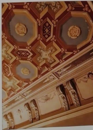
Ploché strop s bohatou iluzivní výmalbou z roku 1883