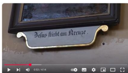
Zehnaní obnovené křížové cesty na Horním Polubném

https://www.youtube.com/watch?v=CncoWmcD1Ko&t=4s )